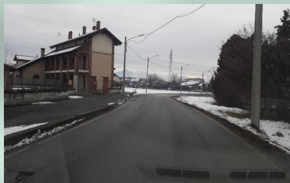
Via Ceretta Inferiore in direzione San Maurizio 2019

Troppo tempo è passato e i cittadini vogliono risposte e decisioni concrete da parte del Comune di San Maurizio Canavese.