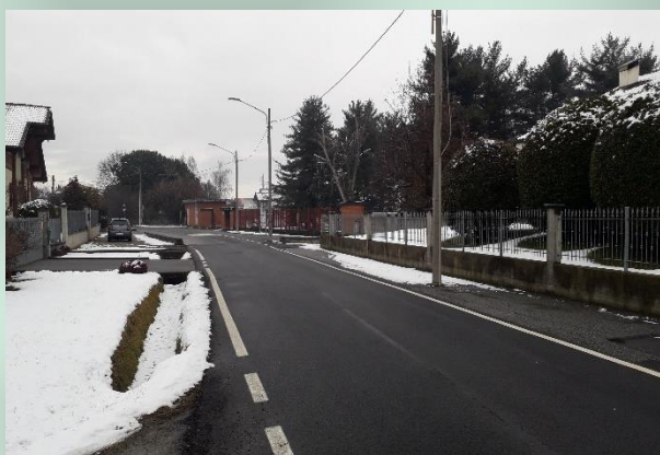
Via Ceretta Inferiore in direzione San Maurizio Canavese

Sono passati tre anni dalla nostra segnalazione e a febbraio del 2019 la situazione non è cambiata. I privati non sono intervenuti e nemmeno il Comune.