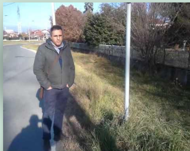
Video di via Ceretta inferiore anno 2015 clicca sull'immagine per vederlo

Vivisanmaurizio aveva segnalato con un video su You Tube la pericolosità in quel punto di via Ceretta inferiore sprovvista di marciapiedi e di dossi per rallentare il traffico.